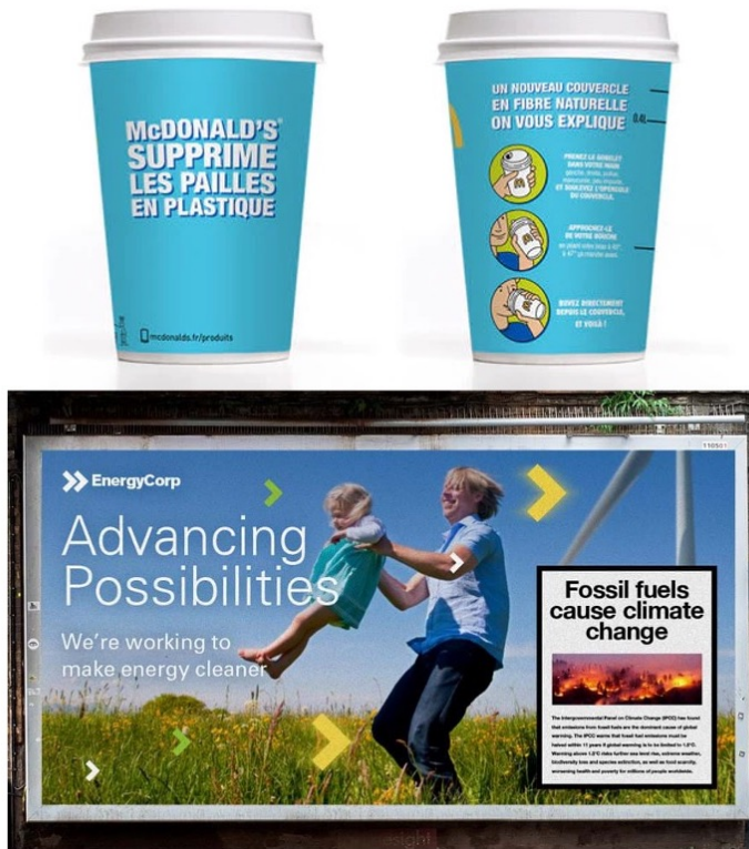
Figure 5. illustration du greenwashing par manque de transparence par obligation réglementaire ( haut ) ou par création d'ambiguïté ( bas ).

l'ambiguïté en gonflant exagérément une de ses actions en lien avec la préservation de l'environnement. Nous pourrions ainsi prendre l'exemple d'une entreprise active dans les énergies fossiles qui se positionne comme un « leader dans les énergies renouvelables », alors que ses investissements dans cette branche restent marginaux ( Figure 5, bas ).