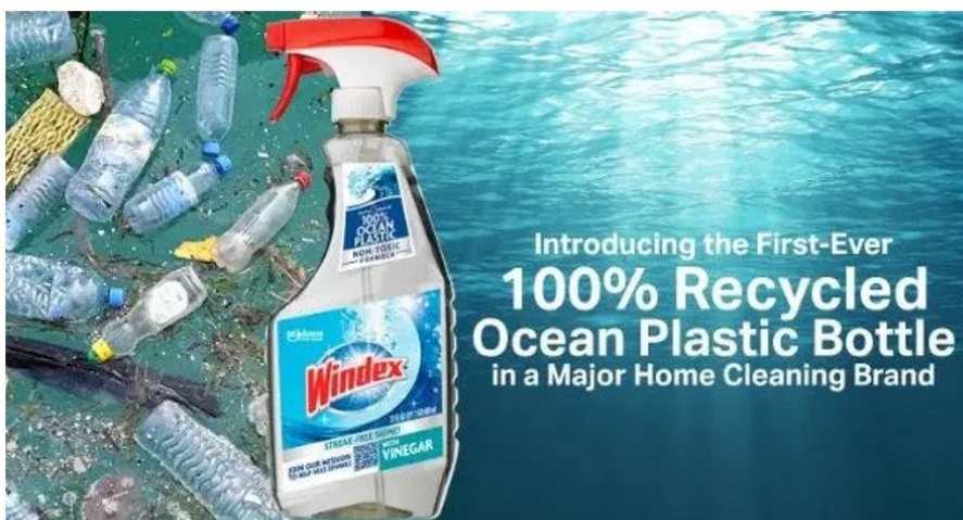
Figure 7. Greenwashing par mensonge frontal ou par omission. Dans

Cette pratique consiste, on l'aura vite compris, à mentir sur le produit ou sur l'emballage ou à oublier de mentionner certains détails cruciaux. Le cas le plus évident à comprendre est celui des bouteilles en matières plastiques « d'origine végétale » ou en bioplastiques, intégrés uniquement partiellement dans certains emballages. Comme nous l'avons déjà évoqué précédemment ici , ces pratiques induisent le consommateur en erreur et sous-tendent des erreurs d'appréciation, notamment sur la fin de vie de ces matériaux plastiques. C'est le cas aussi des produits (ou emballages) qui se déclarent « faits en plastiques recyclés » alors que ces derniers ne sont présents qu'en quantités assez modérées ou bien de certains produits ou emballages dont l'origine est volontairement dissimulée ou inventée ( Figure 7 ).