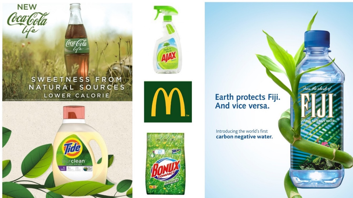
Figure 8. Exemples d'emballages trompeurs

La dernière pratique de greenwashing est en lien avec l'emballage uniquement. Elle consiste à utiliser des formes, des couleurs, ou des codes lexicaux visuels sur-exprimés. Utiliser la couleur verte pour rappeler de manière subliminale l'environnement est une pratique de greenwashing, utiliser des visuels avec des plantes ou des arbres est aussi un comportement trompeur. Il en va de même pour l'usage de certains termes comme « fraîcheur naturelle » ou certaines formes d'emballage ( Figure 8 ).