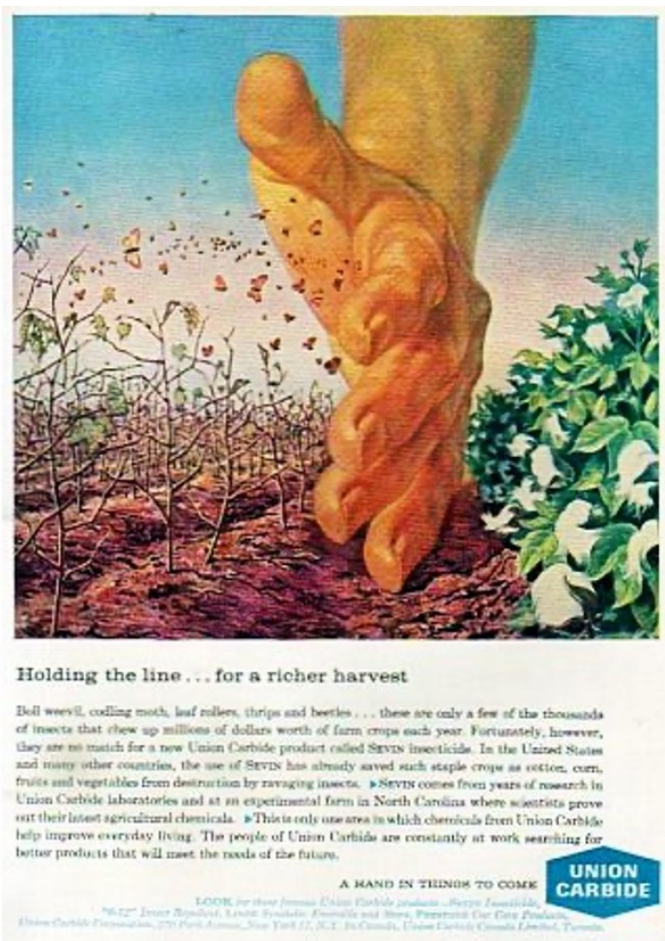
Figure 1. Reproduction d'un encart publicitaire de 1963 vantant les mérites des insecticides de synthèse vendus par une compagnie chimique.

et respectueuses de l'environnement ont commencé à inonder les journaux, les magazines, les radios et la télévision. Alors que le DDT, puissant pesticide de synthèse, est largement décrié par les experts et que la défiance du grand public envers les industries chimiques s'installe, ces sociétés chimiques décidèrent de s'offrir une nouvelle image plus rassurante par le biais de campagnes publicitaires chargées de clichés de nature, de papillons, et de plantes ( Figure 1 ).