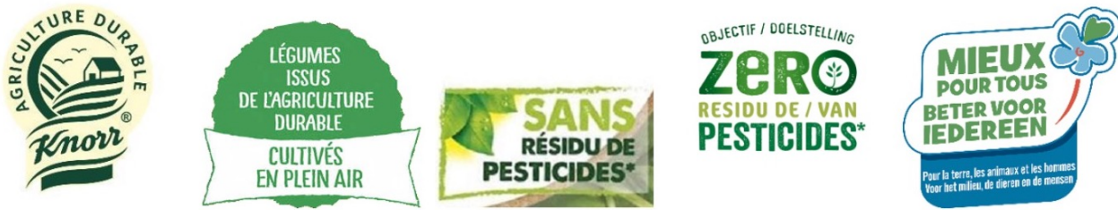
Figure 6. Quelques exemples de faux labels

« issus d'une agriculture durable », « avec réduction de l'empreinte carbone », « bons pour tous », « bons pour la nature », ou « équitables » ( Figure 6 ).