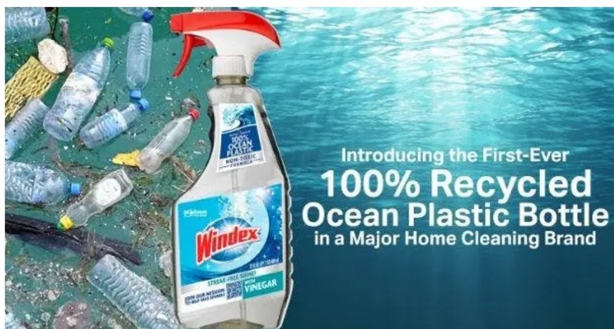
Figure 7. Greenwashing par mensonge frontal ou par omission. Dans

Cette pratique consiste, on l'aura vite compris, à mentir sur le produit ou sur l'emballage ou à oublier de mentionner certains détails cruciaux. Le cas le plus évident à comprendre est celui des bouteilles en matières plastiques « d'origine végétale » ou en bioplastiques, intégrés uniquement partiellement dans certains emballages. Comme nous l'avons déjà évoqué précédemment ici , ces pratiques induisent le consommateur en erreur et sous-tendent des erreurs d'appréciation, notamment sur la fin de vie de ces matériaux plastiques. C'est le cas aussi des produits (ou emballages) qui se déclarent « faits en plastiques recyclés » alors que ces derniers ne sont présents qu'en quantités assez modérées ou bien de certains produits ou emballages dont l'origine est volontairement dissimulée ou inventée ( Figure 7 ).